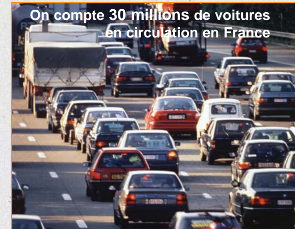
On compte 30 millions de voitures en circulation en France

La démocratisation de l'automobile a abouti à une civilisation de la mobilité . Dans l'agglomération de Rouen, 90% des déplacements sont effectués en voiture. On ne "vit" plus dans nos villes, on y dort ou on les traverse. On prend la voiture, pour aller travailler (20%), faire ses courses dans de gigantesques centres commerciaux en périphérie (15%) mais, la moitié du temps, pour nos loisirs .