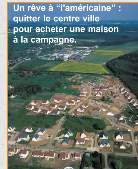
Un rêve à "l'américaine" : quitter le centre ville pour acheter une maison à la campagne.